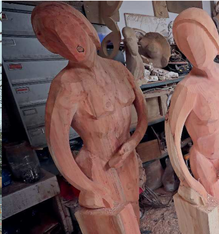
← Sculpture autour de la légende des naufrageurs à Chaucre, sur la route des Huttes, à Saint-Georges-d'Oléron. Réalisée à partir d'une souche